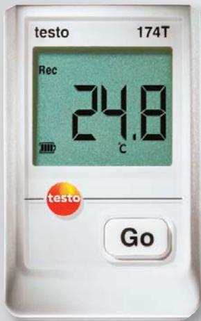
Imagen a tamaño real