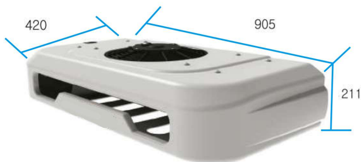
Condensador Dimensiones 905×420×211(L×W×H/mm)