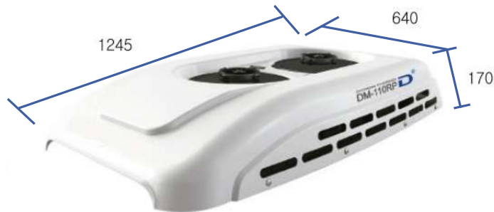
Condensador Dimensiones 640×1245×170(L×W×H/mm)